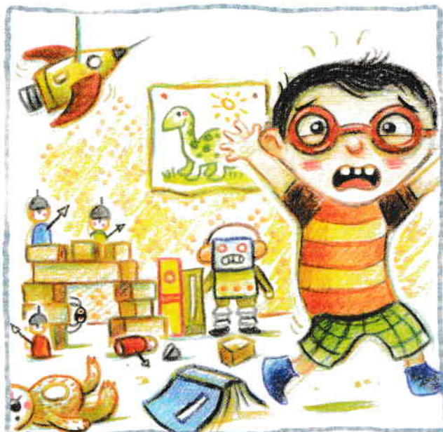
în colțuri întunecoase,